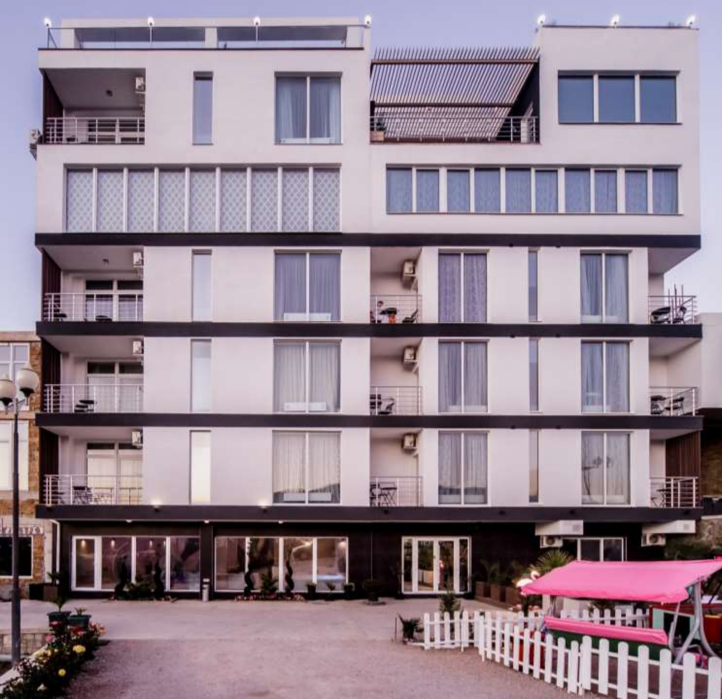
Санаторий «КРЫМСКИЙ ГОСТЬ» в г. Алушта